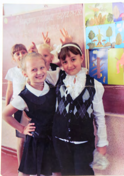
ФОТО НА ЗГАДКУ